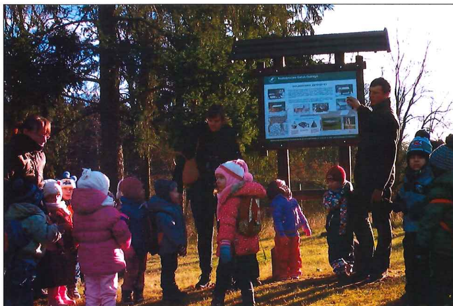
Tablice edukacyjne Leśnictwo Leśno

Tablice edukacyjne – Leśnictwo Leśno – przy leśniczówce zlokalizowanych jest 6 tablic dydaktycznych wykorzystywanych podczas zajęć edukacyjnych.