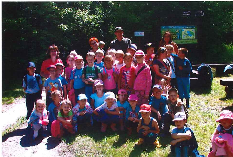
Ścieżka historyczno – przyrodnicza Grodno

Przystanki oznakowane są w terenie ponumerowanymi słupkami. W Nadleśnictwie Golub-Dobrzyń, Leśnictwie Gronowo i Urzędzie Gminy Chełmża dostępny jest folder o ścieżce z opisem poszczególnych przystanków. Poniżej folder można pobrać w wersji elektronicznej.