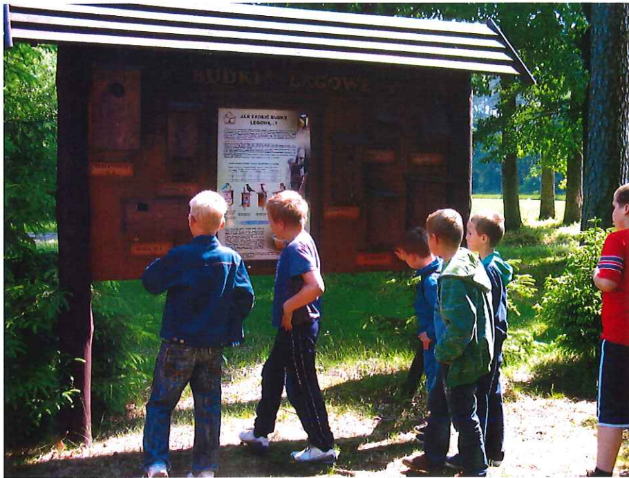
Punkt edukacji leśnej w Szkółce Przeszkoda

Punkt edukacji leśnej Szkółka Przeszkoda wyposażony jest w tablice poglądowe oraz wiatę z miejscem na ognisko. Wycieczki oprowadza leśniczy szkółkarz omawiając ogólne zagadnienia z dziedziny leśnictwa, ekologii, a także tematykę szkółkarską.